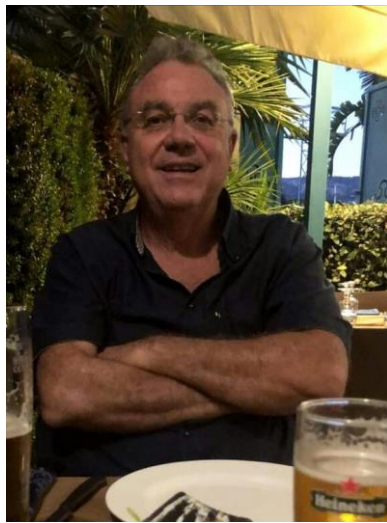
Author: Claudio Paterna, Cultural Department of Splendid Sicily